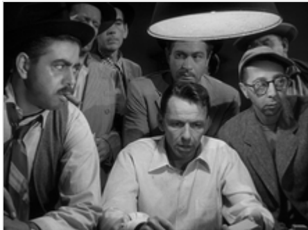
Frank Sinatra, al centro, in una scena

Il film venne adattato da Walter Newman , Lewis Meltzer e Ben Hecht (non accreditato) e diretto da Otto Preminger . Sinatra ottenne la candidatura all' Oscar al miglior attore protagonista , e venne ulteriormente candidato come migliore attore ai BAFTA e The New York Film Critics . La Motion Picture Association of America rifiutò di dare il visto che certificava l'approvazione del film sotto le norme del Codice Hays perché si trattava di un tema molto forte: la tossicodipendenza dalle droghe . L'anno successivo il codice venne cambiato consentendo ai film di trattare temi come droga , rapimenti , aborti e prostituzione .