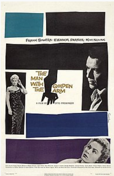
La locandina realizzata da Saul Bass